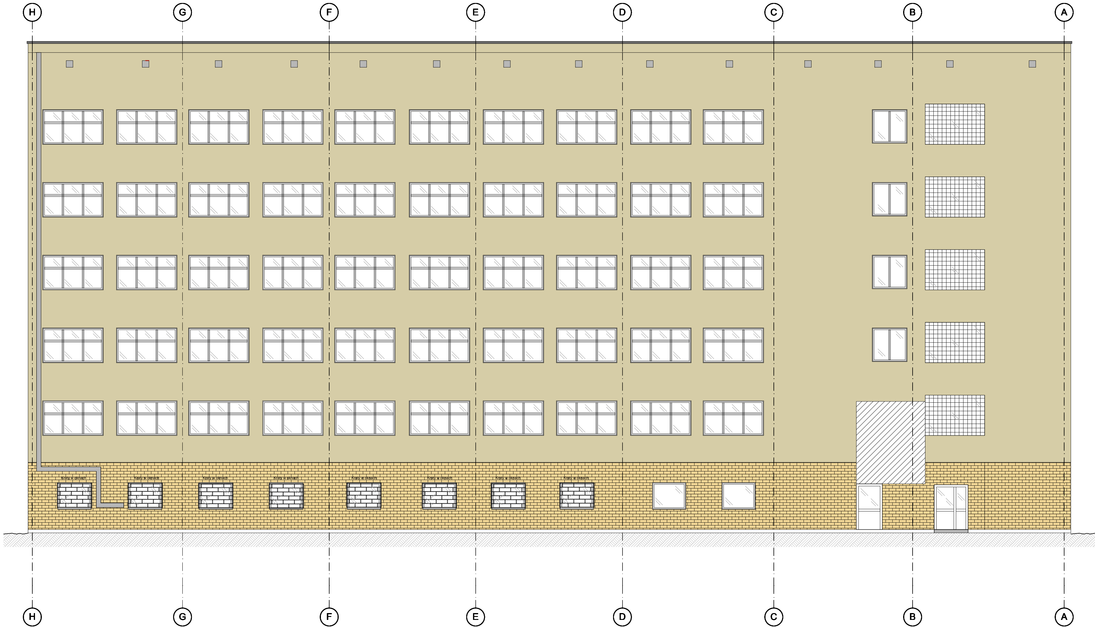
ELEWACJA TYLNA- PÓŁNOCNA